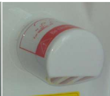
Scatola vapore vista dal retro